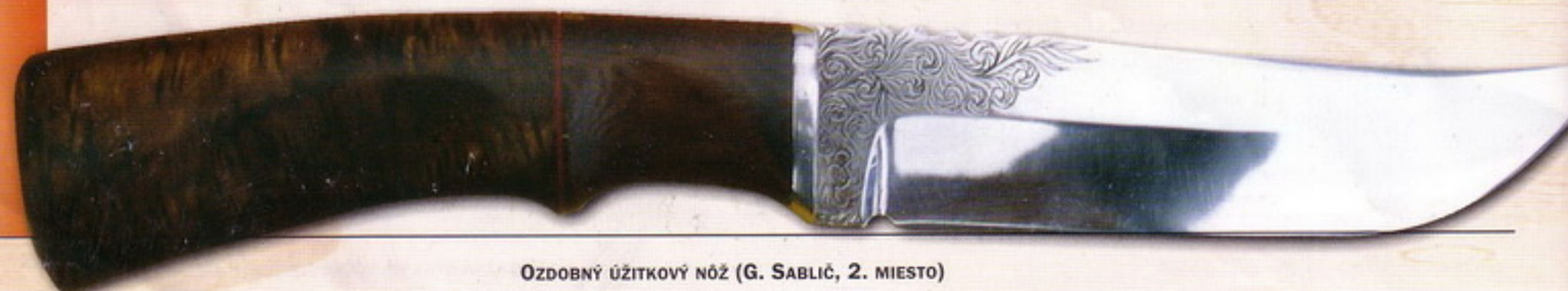
OZDOBNÝ ÚŽITKOVÝ NÔŽ (G. SABLÍČ, 2. Miesto)